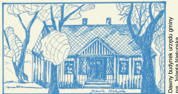
Dawny budynek urzędu gminy rys. Jolanta Niećupska

Czy kolejna opowieść Cię porwie, zaraz się okaże: Wiesz, że pod Tobą biec mogą podziemne korytarze? Wiadomo, że od rynku do kościoła prowadzą jakoby. Nikt nie wie jednak, czy to prawda. Oby!