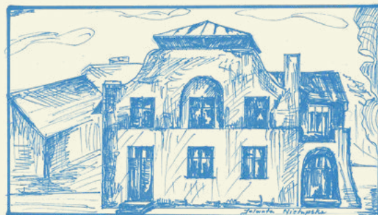
Dawny dom ludowy rys. Jolanta Niećupska

Wróć. Przy wejściu rzeszowski artysta miejsce wymościł Dla granitowego papieża-Polaka naturalnej wielkości. Dłoń na \frac{\square\square}{23} \frac{\square\square}{20} zaświadcza o dobrej nowinie.